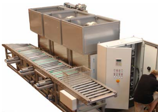
Sonderanlage für die vollautomatische Reinigung von Kleinteilen

Die Firma EuroTec hat in der Projektierung und in der Konstruktion erfahrene Ingenieure, die das Problem in Zusammenarbeit mit dem Kunden angehen.