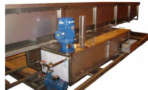
Sonderanlage für die Reinigung von Walzen mit 6 m Länge